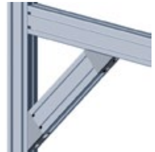
Winkelverbinder 40/80, 45° Angle Connector 40/80, 45°